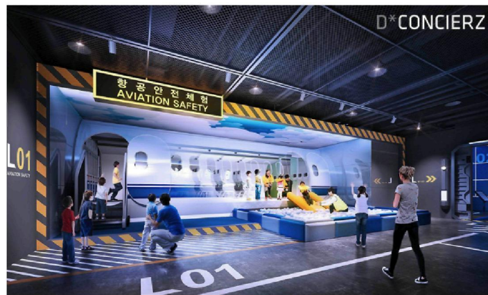
Рисунок 1. – Центр безопасности, Инчхон, Южная Корея

Хайдяне (Китай) создание образовательного центра (рисунок 3) было обусловлено стихийными бедствиями, возникающими на территории страны. Однако, кроме природных чрезвычайных ситуаций, отрабатываются и техногенные, а также правила пользования огнетушителем, оказания первой помощи и набора номера 110 (номер милиции в Китае). Центр безопасности создан и в Лимме (Великобритания). Он состоит из интерактивных учебных зон (рисунок 4), включая зону личной безопасности, полномасштабный дом, городскую улицу и участок сельской местности. Эти зоны позволяют моделировать общественно опасные ситуации, с которыми необходимо уметь справляться каждому человеку.