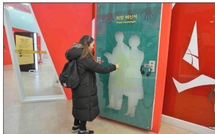
Рисунок 2. – Центр безопасности, Чхонан, Южная Корея