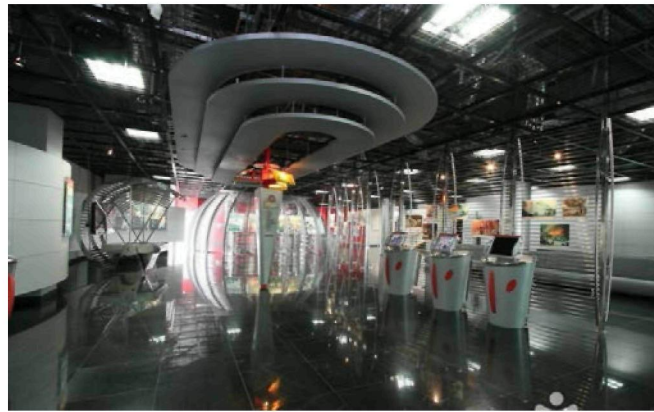
Рисунок 3. – Центр безопасности, Хайдянь, Китай